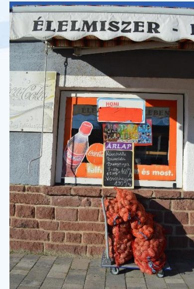
„Hagyományos” helyi kisbolt