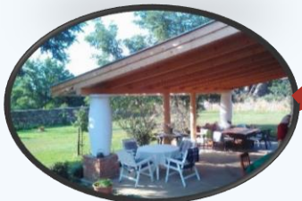
Saját értékesítő helyel rendelkező