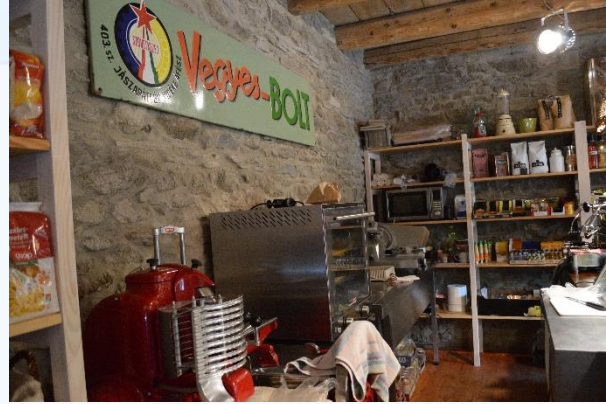
„Delikátosodó” helyi kisbolt