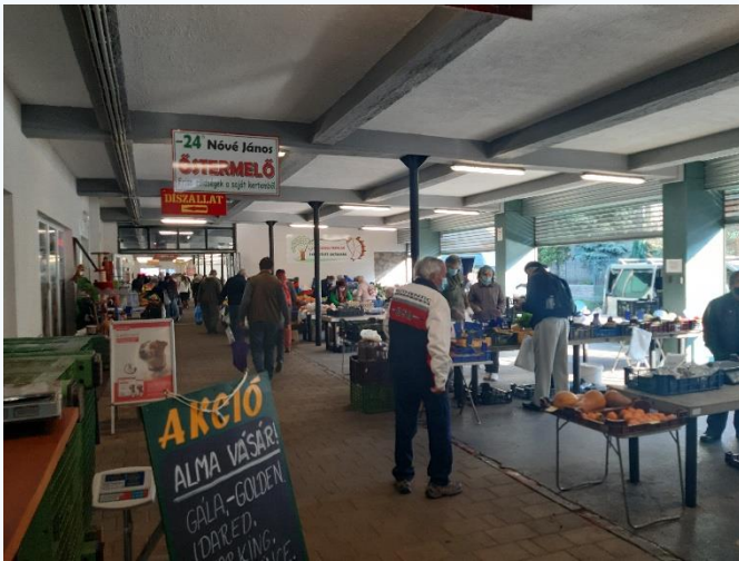
Környékbeli vásárcsarnok – hagyományos piac